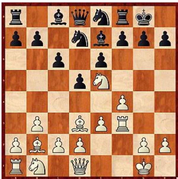
Beispiel 2: Ist Lxh7+ gut?