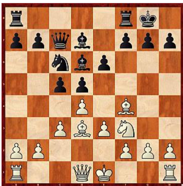
Beispiel 3: Ist Lxh7+ gut?