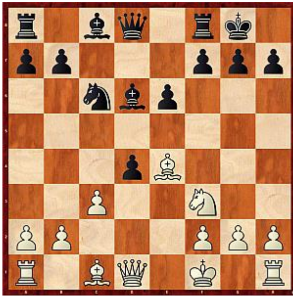
Beispiel 4: Ist Lxh7+ gut?